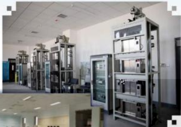
智能电梯安装调试维护训练场所