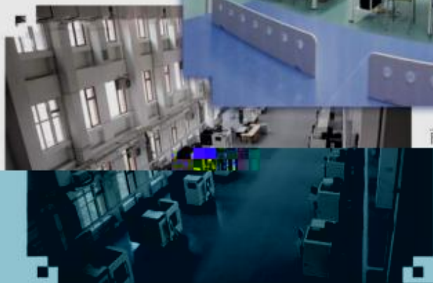
DMG 数控技术训练场所